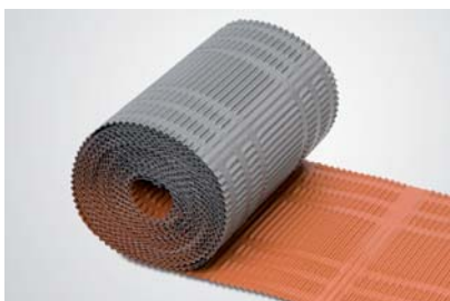
Universal-Traufenrolle Aluminium, beidseitig verwendbar