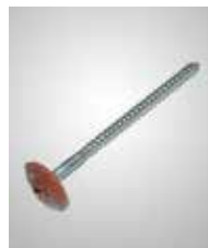
Spenglerschrauben, farbig beschichtet