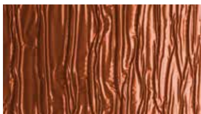
WK-Alu Stretch Detailansicht Oberseite