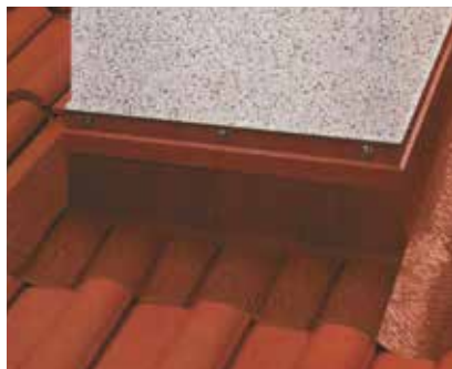
Überlappende Verklebung problemlos möglich